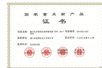
国家重点新产品证书