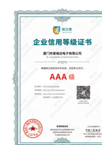
企业信用等级证书