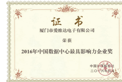
中国数据中心最具影响力企业奖