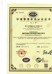
环境管理体系认证证书