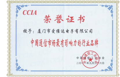
中国通信市场最有影响力的行业品牌