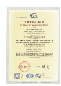
质量管理体系认证证书