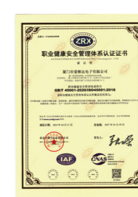
职业健康安全管理体系认证证书