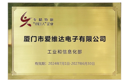
国家级专精特新企业