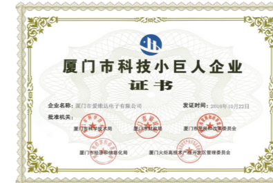
厦门市科技小巨人企业