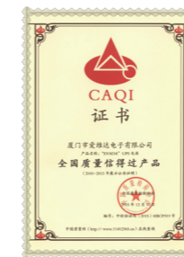
全国质量信得过产品