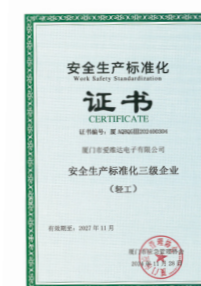
安全生产标准化三级企业